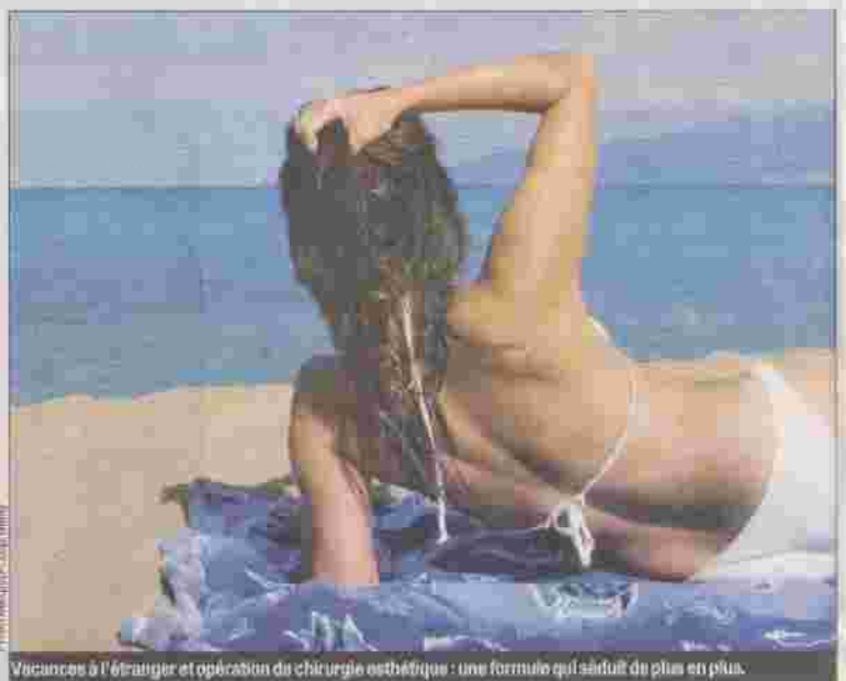
Vacances à l'étranger et opération de chirurgie esthétique : une formule qui séduit de plus en plus.

La Direction générale de la santé mettrait-il y a quelques années en garde les personnes susceptibles de recourir à ce type de prestations. Les actes médicaux esthétiques ne relèvent pas du statut d'agent de voyage (art. L.211-1), c'est illégal et si une agence française proposait ces prestations, elle serait poursuivie et sanctionnée. Ces forfaits sont donc proposés par des tour-